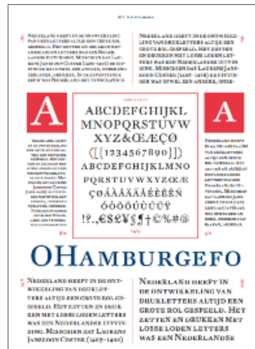
Arriba: Página del espécimen de DTL Fleischmann (ver más en: www.dtl.nl ) correspondiente a la variable regular (incluye small caps). Abajo: detalle de la página 13 (variable italic, ligaduras)

☞ Bloques de texto continuo : por ejemplo fragmen-